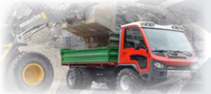
Aebi TP 420

Iz koncerna ASH – Aebi Schmidt vam lahko na podlagi vaših želja in zahtev ponudimo transporterje znamke Aebi, in sicer serije MT, TP ter VT. Pester nabor modelov omogoča izbiro ustrezne nadgradnje, možno pa jih je opremiti z različnimi priključki, s čimer postanejo transporterji multifunkcijska vozila, namenjena širokemu krogu uporabe. Moderni motorji, ki ustrezajo najstrožjim emisijskim merilom, nezahtevno vzdrževanje, kvaliteta izdelave, široka izbira dodatne opreme ter nizka poraba goriva so zagotovilo za vaše zadovoljstvo ter nemoteno izvajanje del.