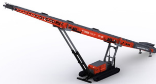
Transportni trak Terex® Finlay TC-100

Kot dopolnitev ponudbe za separacije in kamnolome lahko iz programa Terex® Finlay izberete tudi transportne trakove, teže od 11 300 kg naprej in dolžine med 20 m in 30 m.