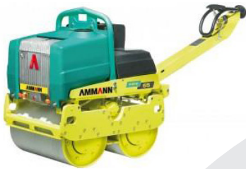
Ročno vodeni valjar ARW65

Za potrebe vgrajevanja asfaltnih zmesi vam lahko ponudimo valjarje različnih izvedb, in sicer ročno vodene, tandemske in pnevmatske ter finišerje delovnih širin od 1.200 mm do 4.900 mm, teže od 5 200 kg do 17 500 kg.