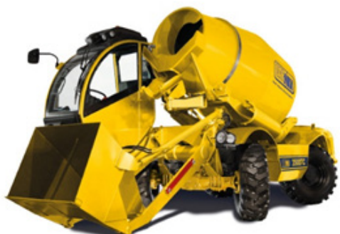
Mobilni mešalnik betona Carmix 3500TC

V kolikor potrebujete zanesljiv stroj za pripravo betonskih zmesi neposredno na gradbišču oz. delovišču, vam lahko ponudimo mobilne mešalnike betona znamke CARMIX. Mobilni mešalniki betona so kvalitetno izdelani in premišljeno zasnovani, njihova možnost samostojnega nakladanja pa poenostavi delo neposredno na terenu. Opcijsko je mobilne mešalnike betona možno opremiti z ustreznimi tehtnicami, glede na potrebe pa lahko izbirate med različnimi modeli in njihovimi zmogljivostmi, vsem pa sta skupni kvaliteta izdelave ter optimalni stroški uporabe in vzdrževanja.