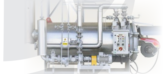
Topilec bitumna HEATTEK