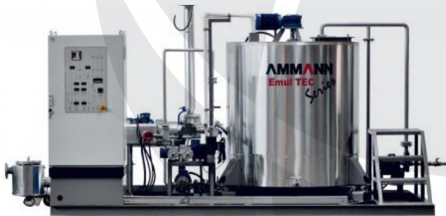
Proizvajalec bitumsne emulzije EMULTEK 4

Vse, kar potrebujete za nemoteno proizvodnjo asfaltnih zmesi, od priprave do skladiščenja materiala. Na voljo so mobilni drobilci, separatorji, naprave za proizvodnjo bitumsne emulzije serije EMULTEK z zmogljivostjo od 4 t/h do 15 t/h, topilci bitumna, grelci bitumna ter električno ogrevani zalogovniki bitumna.