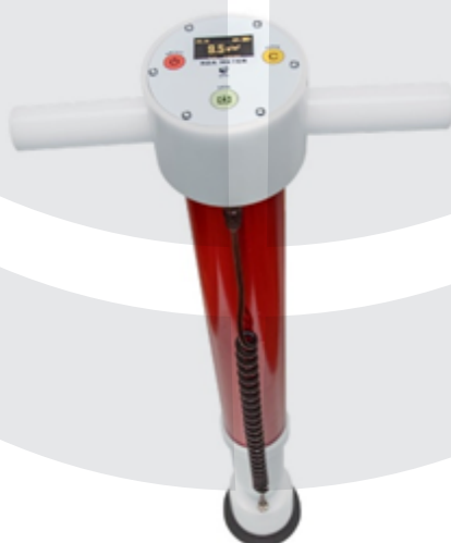
Merilec slanosti - RDA meter

Merilci slanosti, ki s svojo natančnostjo delovanja omogočajo ločljivost merjenja \pm 0,1 \text{ g/m}^2 , pri točnosti meritve \pm 0,5 \text{ g/m}^2 in \pm 0,1 \text{ }^\circ\text{C} . Merilci opcijsko omogočajo spremljanje GPS lokacije izvedbe meritve ter prenos podatkov na strežnik, kar olajša spremljanje in analizo pridobljenih informacij.