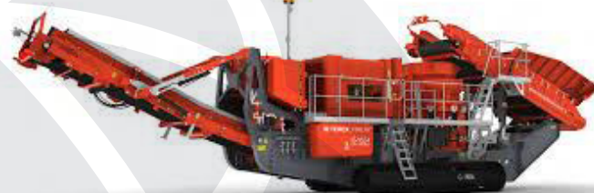
Konusni drobilec C-1554