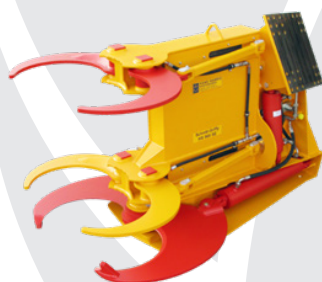
Schnitt-Griffy HS 960 SE

Podjetje Hans Habbig Maschinenbau je proizvajalec škarij za rezanje vej ter drevja. Priključki omogočajo rezanje dreves in vej različnih premerov, njihova namestitvev pa je možna na različne delovne stroje.