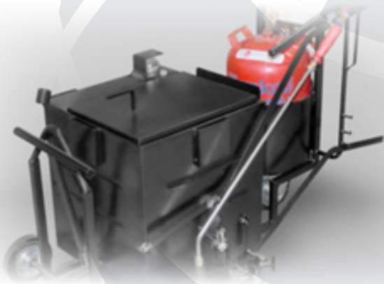
Kombinirani kuhalnik KK50

Kombinirani kuhalniki proizvajalca Nadler Straßentechnik za pripravo mas za zalivanje asfaltnih razpok, volumna od 20 litrov do 700 litrov. Ponudimo vam lahko kombinirane kuhalnike enostavnejše izvedbe, prav tako pa so v prodajnem programu kuhalniki večjih zmogljivosti, namenjeni izvajanju del v večjem obsegu, zasnovani kot priključno vozilo.