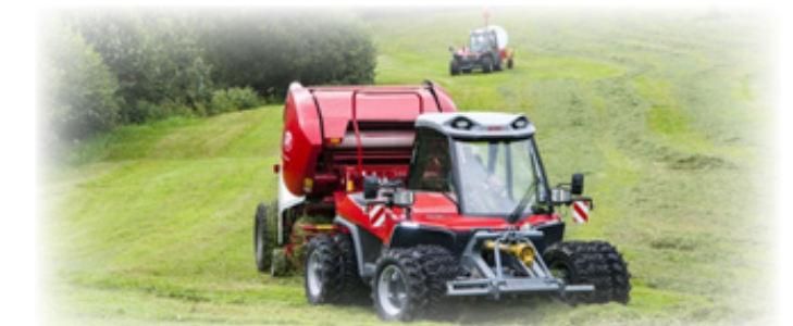
Aebi TT 281