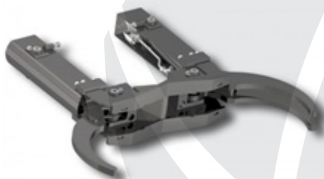
NOX priponke in dodatki