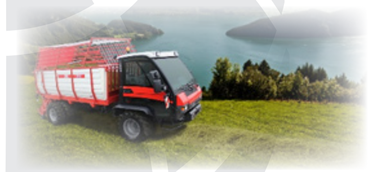
Aebi TP 410