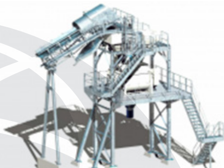
Betonarna CBS 105-150 S/T B ELBA