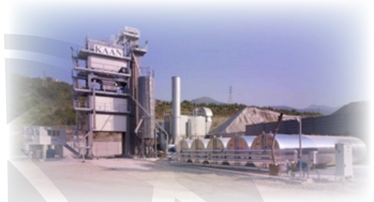
Asfaltna baza ABA 100-340 UNIBATCH