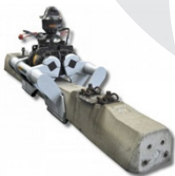
Grabež za tire in pragove