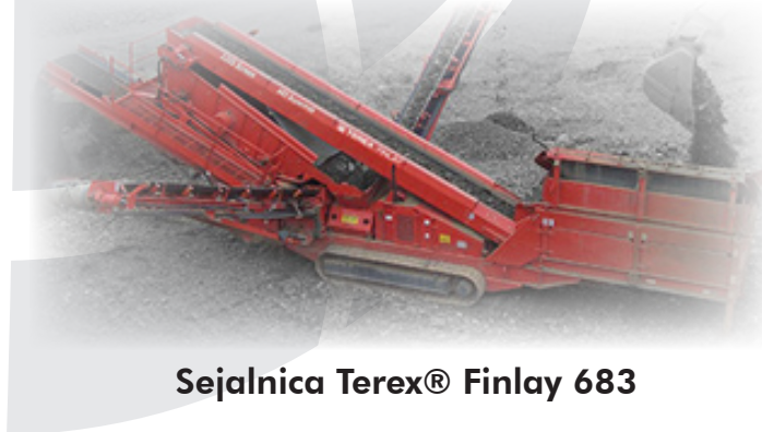
Sejalnica Terex® Finlay 683