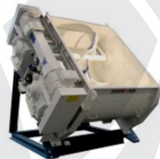
TWIN-SHIFT mešalnik betona

Prodajni program vsebuje planetarne mešalnike, single-shaft mešalnike, twin-shaft mešalnike ter laboratorijske mešalnike, katerih kapaciteta zbranega svežega betona se giblje od 60 l do 4.5 m 3 .