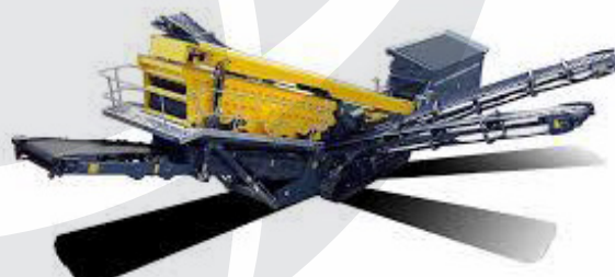
Sejalnica RM MSC8500