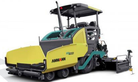
Finišer AMMANN AFW 700