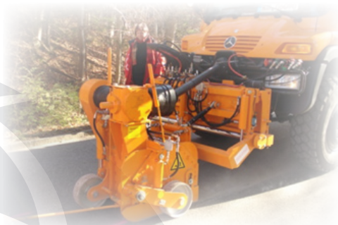
Freza za asfalt AS Baugeräte ASF 500/100 MF