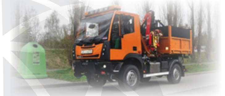
Aebi MT 750