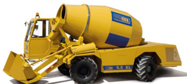
Mobilni mešalnik betona Carmix 5.5XL