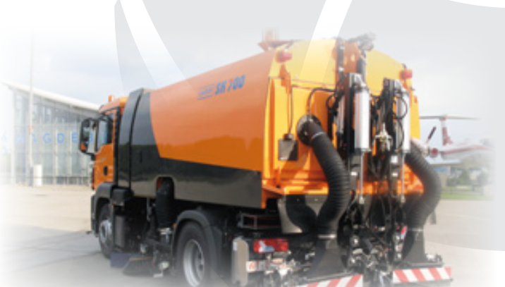
Schmidt SK 700

Iz kategorije strojev za čiščenje cest in javnih površin imamo v ponudbi proizvajalca Schmidt modele Senior 2000 ter serijo MSH, seveda pa vam lahko ponudimo tudi večja vozila iz serij SK 500, SK 600, Street King 660 ter SK 700 in nadgradnje iz serij SK 350 in SK 370.