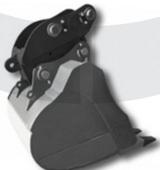
Pin to Pin