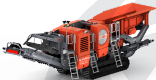
Čeljustni drobilec Terex® Finlay J-960

Paleta čeljustnih drobilcev Terex® Finlay je sestavljena iz strojev teže od 28 000 kg do 79 450 kg, različnih pogonskih moči in zmogljivosti, konusni drobilci proizvajalca Terex® Finlay pa so na razpolago v razponu teže od 33 350 kg do 64 820 kg.