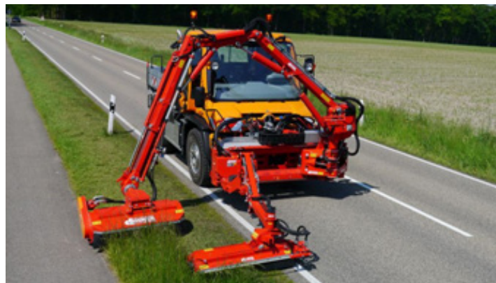
Mulčer Dücker MK 25