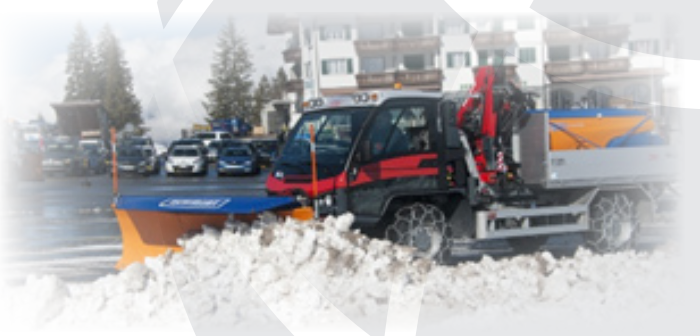
Aebi VT 450