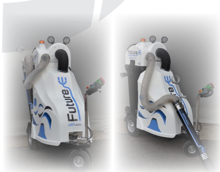
Vakumski sesalni stroj Future-E

Vakumski električni sesalni stroj Future-E je namenjen čiščenju javnih površin in infrastrukture, predvsem v mestnih središčih in strnjениh naseljih, saj ne povzroča hrupa in emisij. Njegova enostavna uporaba in domišljena možnost praznenja posode za odpad omogočata delo z minimalnim naporom, čas delovanja pa je optimizirano usklajen s časom polnjenja baterij.