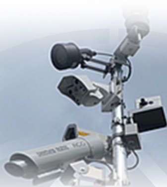
Primer vremenske postaje

Vremenske postaje proizvajalcev Boschung Mechatronic ter Schmidt, ki so namenjene spremljanju in analiziranju pridobljenih vremenskih podatkov, z njihovo pomočjo pa optimiziramo izvajanje zimske službe in imamo ažuren vpogled v stanje razmer na voziščih.