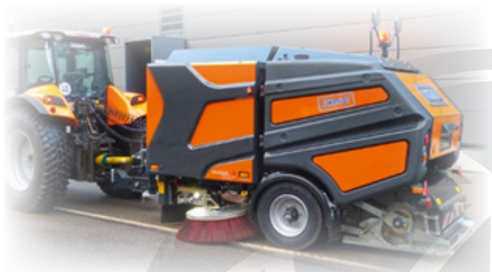
Schmidt WASA 300+

Na razpolago so tudi različni priključki za čiščenje, kot so krtače proizvajalcev AS Baugeräte, Dücker, Kinshofer ter Schmidt.