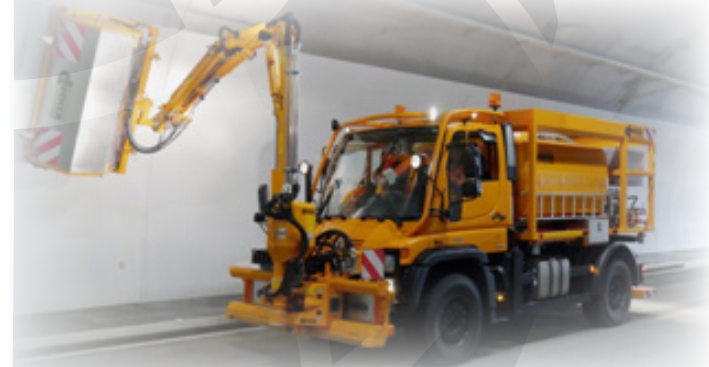
Pripomoček za čiščenje tunelov Dücker TWA 18