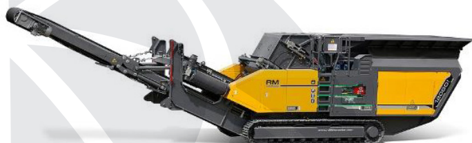
Drobilec RM 120GO!