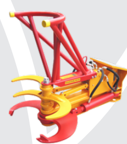
Schnitt-Griffy HS 650