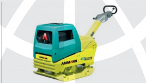
Vibracijska plošča APH 6020