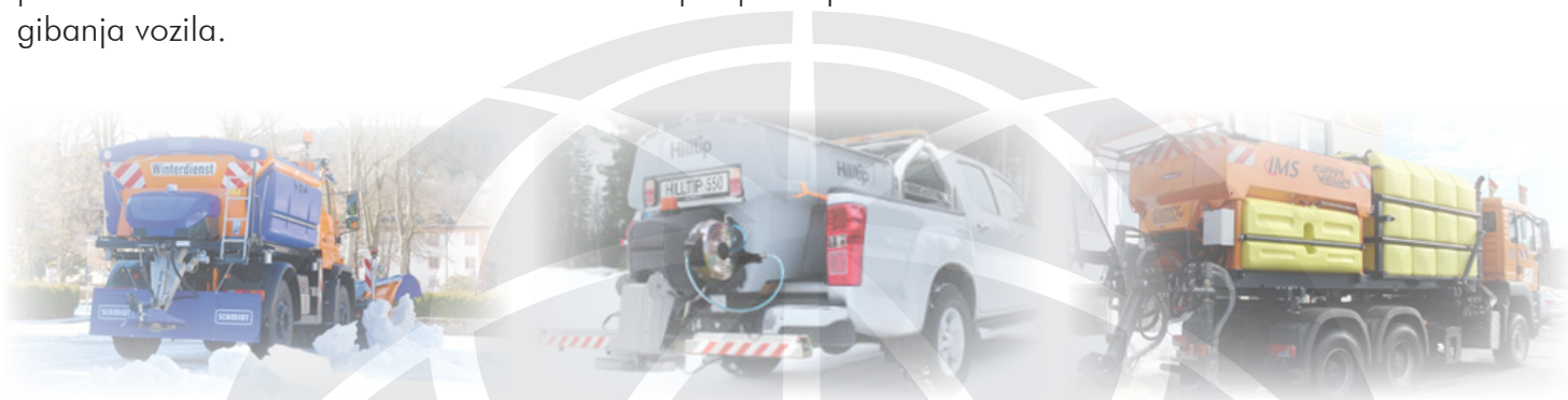
Primeri različnih posipalcev

Za popolno opremljenost za potrebe izvajanja zimske službe imamo v ponudbi posipalce proizvajalcev Schmidt, Kahlbacher, Hilltip ter Küpper Weisser. Na razpolago so posipalci različnih širin, z možnostjo montaže na večnamenska vozila, tovornjake, traktorje in tudi manjša poltovorna vozila. Posipalci so na izbiro v velikosti od 0,5 m 3 do 12 m 3 . Odvisno od potreb lahko izbirate med običajnimi ali samonakladalnimi posipalci, ki omogočajo izvedbo suhega posipa ali kombinacijo suhega in mokrega posipavanja, opcijsko pa lahko izbirate možnost nastavitve količine posipavanja iz kabine z različnimi moduli ter v odvisnosti od gibanja vozila.