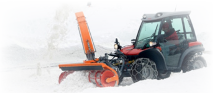
Aebi TT 211

Aebijeva serija TT s svojimi modeli TT 206, TT 211, TT 241 ter TT 281 predstavlja večnamenske traktorje, s katerimi lahko ob ustrezni opremljenosti s priključki izvajate različna dela, tako na področju vzdrževanja javnih površin, infrastrukture kot v kmetijstvu. S svojo kvaliteto, udobjem za upravljalca ter nizkimi stroški obratovanja je serija TT idealna rešitev za marsikatero opravilo.