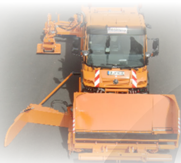
Stroj za urejanje bankin AS Baugeräte BA 150

Nemški proizvajalec AS Baugeräte ima v svojem proizvodnem programu različne priključke in orodja za večnamenska in tovorna vozila, delovne stroje ter traktorje. Iz palete artiklov vam lahko ponudimo freze za bankine, freze za asfalt, freze za obcestne robove, izravnalne deske, stroj za urejanje bankin, na razpolago pa so tudi različni kesoni – prekucniki ter pogonske gredi.