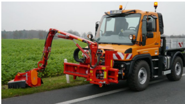
Mulčer Dücker UNA 500

Mulčerji ter ostali priključki proizvajalca Dücker, za montažo na traktor ali večnamensko vozilo. Izbirate lahko med različnimi kombinacijami ali namenskimi orodji. V paleti produktov boste našli primerne priključke tako za traktorje kot za večnamenska vozila, z možnostjo priključitve na sprednji ali zadnji del nosilnega vozila.