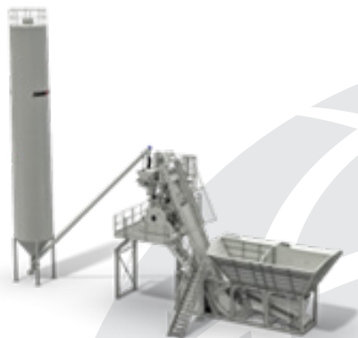
Betonarna CC 60 ELBA

Betonarne proizvajalca AMMANN, namenjene proizvodnji betona, z zmogljivostjo od 60 m 3 /h do 190 m 3 /h. Prostornine mešalnikov se gibljejo od 1000 litrov pa vse do 45 000 litrov – v ponudbi lahko tako najdete idealno rešitev za vaše zahteve, določeni modeli betonarn pa imajo modularno zasnovo, kar pomeni, da jo lahko v skladu z vašimi potrebami nadgrajujete v času obratovanja.