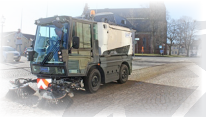
Schmidt Swingo 200

Za učinkovito čiščenje cest in javnih površin lahko pri nas dobite pometalne stroje proizvajalca Schmidt. Iz proizvodnega programa lahko izbirate med pometalnimi stroji serij Swingo ter Cleango, ponujamo pa tudi električni pometalni stroj eSwingo. Pometalni stroji imajo kapaciteto med 2,0 m 3 in 4,0 m 3 .