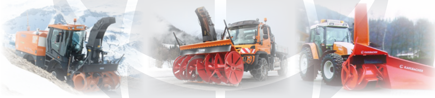
Primeri različnih snežnih frez

Kot priključke, namenjene izvajanju zimske službe, vam ponujamo tudi snežne freze proizvajalcev Kahlbacher in Schmidt. Snežne freze iz našega prodajnega programa so namenjene tako priključitvi na večnamenska vozila kot tovornjake in traktorje, na razpolago pa so tudi snežne freze kot samostojno vozilo. Izbirate lahko med različnimi kapacitetami ter načinom pogona – kot priključek ali s samostojnim pogonskim sklopom.