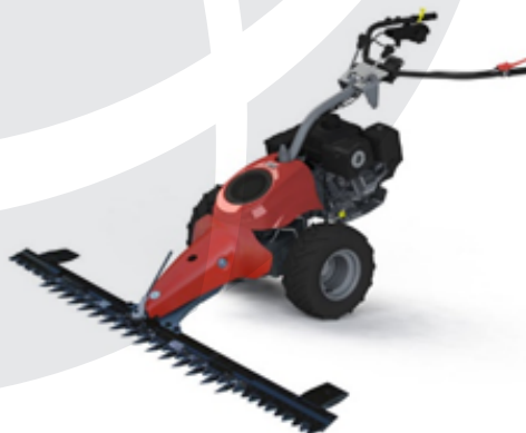
Kosilnica AEBI CC110