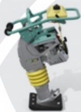
Vibracijsko nabijalo ATR 68

Iz programa valjarjev in nabijalne tehnike za zemeljska dela vam lahko ponudimo vibracijska nabijala teže od 28 kg do 83 kg, vibracijske plošče teže od 54 kg do 715 kg, valjarje delovne širine od 1.680 mm do 2.130 mm in teže od 4 030 kg do 21 930 kg ter različne nabijalne priključke in Rammax valjarje za jarke proizvajalca AMMANN.