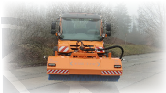
AS Baugeräte FKM Vario 3000