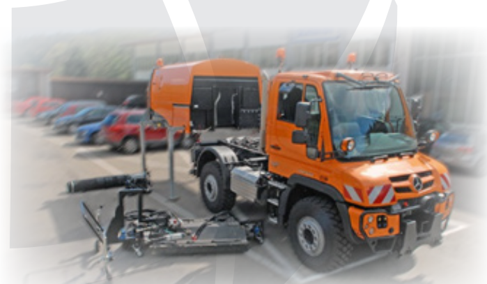
Schmidt SK 350

Stroji za pranje prometnih površin proizvajalca Schmidt, serija CityJet, modela CityJet 6000 ter CityJet 3030, so namenjeni pranju prometnih površin s pomočjo visokega tlaka. S svojimi dimenzijami so primerni tako za mestna središča kot površine izven strnjenih naselij.