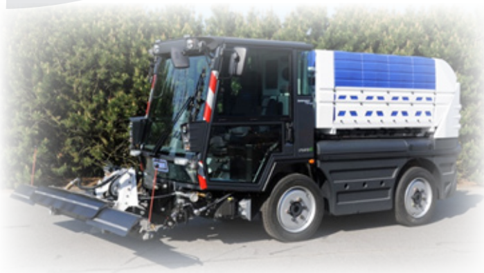
Schmidt CityJet 3030 SW

Stroji za pranje prometnih površin proizvajalca Schmidt, serija CityJet, modela CityJet 6000 ter CityJet 3030, so namenjeni pranju prometnih površin s pomočjo visokega tlaka. S svojimi dimenzijami so primerni tako za mestna središča kot površine izven strnjenih naselij.