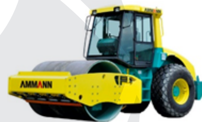
Valjar AMMANN ASC 70