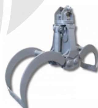
Grabeži za les