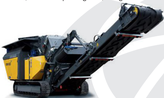
Drobilec RM 90GO!

Prodajni program zajema drobilce različnih velikosti in kapacitete drobljenja od 80 t/h do 350 t/h, teže od 12 000 kg do 35 200 kg. Drobilec, primeren za opravljanje vaše dejavnosti, lahko po želji opremite tudi z različnimi dodatki, kot so sejalne glave, magnetni trakovi in ostala dodatna oprema.