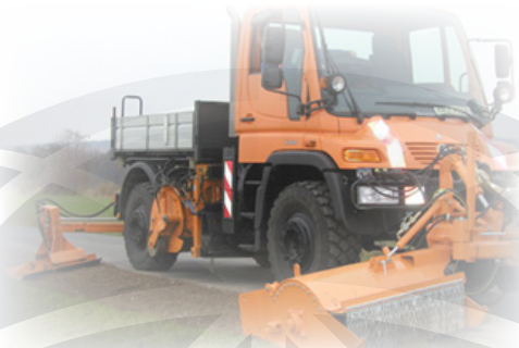
Freza za bankine AS Baugeräte BF 1000S