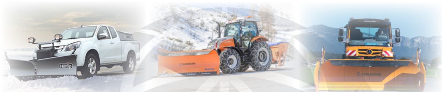
Primeri različnih snežnih plugov

Kot zastopnik več blagovnih znamk vam lahko ponudimo snežne pluge Schmidt, Kahlbacher in Hilltip, različnih delovnih širin in tež, namenjenih izvedbi del tako na javnih poteh kot regionalnih cestah, avtocestah ter letališčih. Ponudimo vam lahko snežne pluge z montažo na večnamenska vozila, tovornjake, traktorje in tudi manjša poltovorna vozila.