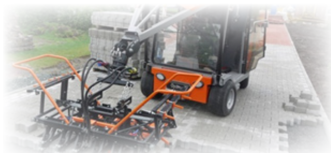
Optimas Type H99