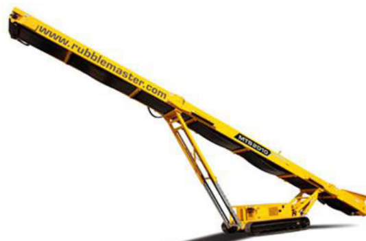
Transportni trak RM MTS 2010

Za optimalno opravljanje vaše dejavnosti vam iz programa proizvajalca Rubble Master lahko ponudimo tudi transportne trakove, višine 9.295 mm ter 10.050 mm, z dolžino traku 20 m in 24 m.