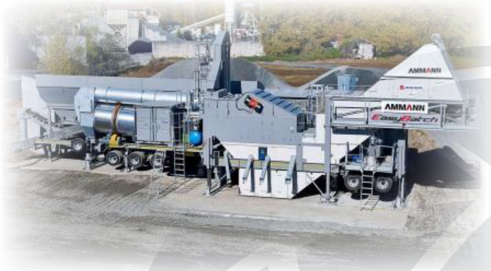
Mobilna asfaltna baza ABM 90-140 EASYBATCH

Ponudimo vam lahko asfaltne baze proizvajalca AMMANN, in sicer so v ponudbi tako mobilne kot stacionarne asfaltne baze, z zmogljivostjo proizvodnje od 90 t/h do 400 t/h ter različnimi volumni mešalniki. Z asfaltnimi bazami AMMANN boste zadovoljili vse potrebe po izdelavi asfaltnih zmesi ter si zagotovili nemoteno in zanesljivo proizvodnjo, ob minimalnih stroških vzdrževanja.