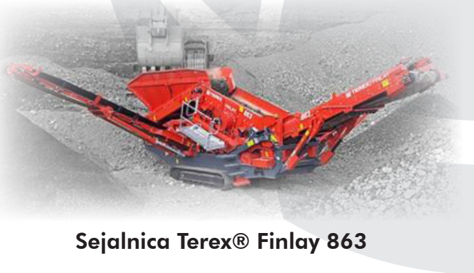
Sejalnica Terex® Finlay 863

V prodajnem programu proizvajalca Terex® Finlay najdete nagibna sita, visoko zmogljiva mrežna sita, visoko zmogljiva sita ter horizontalna sita. Ponudimo vam lahko dvo-, tri- in štiri- nivojska sita, teže od 18 300 kg do 48 000 kg. Sita so, odvisno od modela, opremljena s Caterpillar ali Deutz motorjem, moč motorja se giblje od 49 kW do 151 kW.