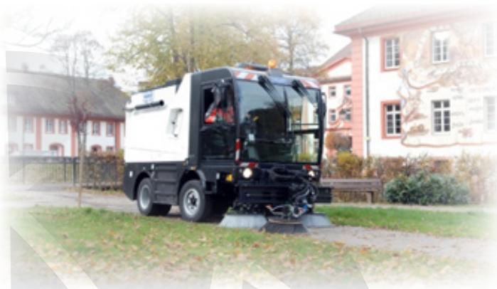
Schmidt Cleango 500

Iz kategorije strojev za čiščenje cest in javnih površin imamo v ponudbi proizvajalca Schmidt modele Senior 2000 ter serijo MSH, seveda pa vam lahko ponudimo tudi večja vozila iz serij SK 500, SK 600, Street King 660 ter SK 700 in nadgradnje iz serij SK 350 in SK 370.