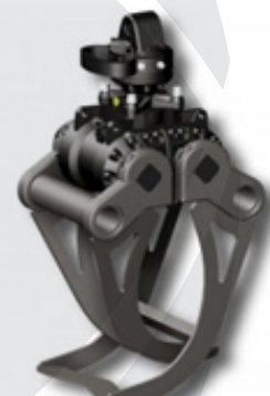
Grabeži za kamenje