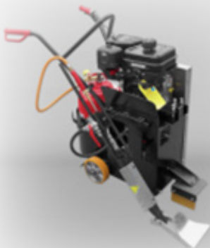
Kompresor Mini z vročim zrakom

Oprema proizvajalca Nadler Straßentechnik za pripravo asfaltnih površin pred izvajanjem sanacij. Ponudimo vam lahko kompresorje – izpihvalce vročega zraka, kompresorje za robnike, rezalnike za asfalt ter sušilnike površin. V prodajnem programu lahko izbirate med artikli, ki bodo zadovoljili vaše zahteve in potrebe, odlikujeta pa jih zanesljiva zasnova ter preprosta uporaba.