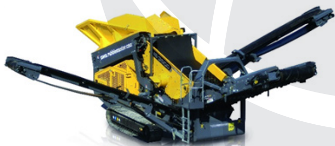
Sejalnica RM TS3500

V ponudbi proizvajalca Rubble Master so tudi sita oz. sejalnice, dvo- ali tri nivojske, za različne namene sejanja oz. uporabe. Odlikuje jih zanesljivo delovanje in so v kombinaciji z drobilci Rubble Master idealna rešitev za vašo dejavnost.