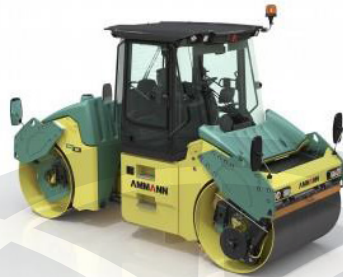
Tandemski valjar ARX 90